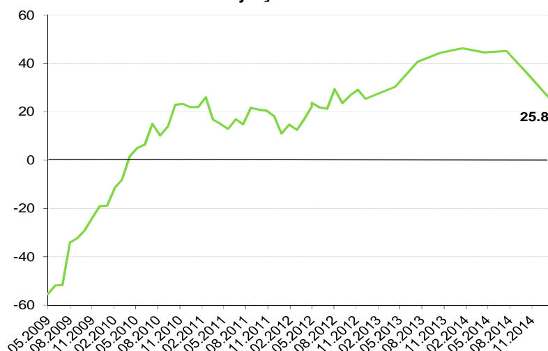
SEB Mājokļu cenu indikators

© SEB banka, 2015 Šis dokuments ir informatīva rakstura izdevums un nesatur ieteikumus. Izdevumā izmantota par ticamiem uzskatītu avotu informācija, taču izdevuma autori neatbild par šo avotu sniegtajiem viedokļiem un faktu atbilstību īstenībai. Pārpublicēšanas gadījumā atsauce obligāta.