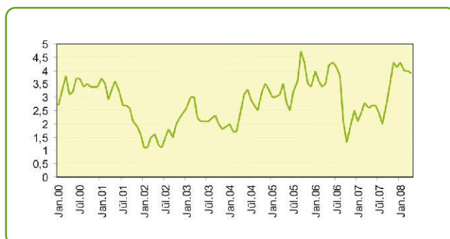
Инфляция в городах США