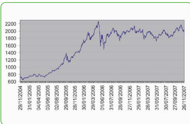
Krievijas RDX indeksa izaugsme pēdējo 3 gadu laikā