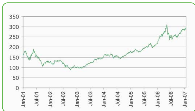
Показатели индекса с 2001 по 2007 год

Предприятия, входящие в этот индекс, работают в отраслях производства, хранения и переработки альтернативной энергии.